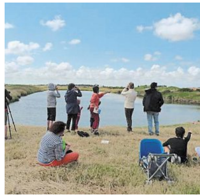
Lyarne. Gratuit. Renseignements, tél. 02 51 74 02 62.

L'association Hirondelle propose une balade au crépuscule dans le marais de Lyarne, ce mardi soir (voir photo). Après un temps d'observation des différentes espèces qui vivent ici et une halte pique-nique, il est proposé un temps pour regarder les oiseaux regagnant leur dortoir. Départ à 19 h 30 du marais de